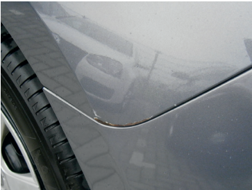
Roest is bij de kwaliteit van de auto's van tegenwoordig altijd een signaal van een nog niet herstelde lakbeschadiging. Meld lakschade en roestschade dan ook tijdig aan Broekhuis Lease om nog grotere schade te voorkomen.