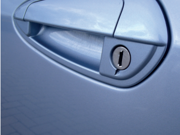
Schade door inbraak .

Natuurlijk zijn er veel meer soorten van schade dan in dit boekje vermeld. Toch willen we proberen ook de laatste punten waar we op letten bij inlevering van uw leaseauto hier nog noemen. Niet in de veronderstelling elke discussie achteraf te voorkomen, maar wel in 99,9% van alle gevallen.